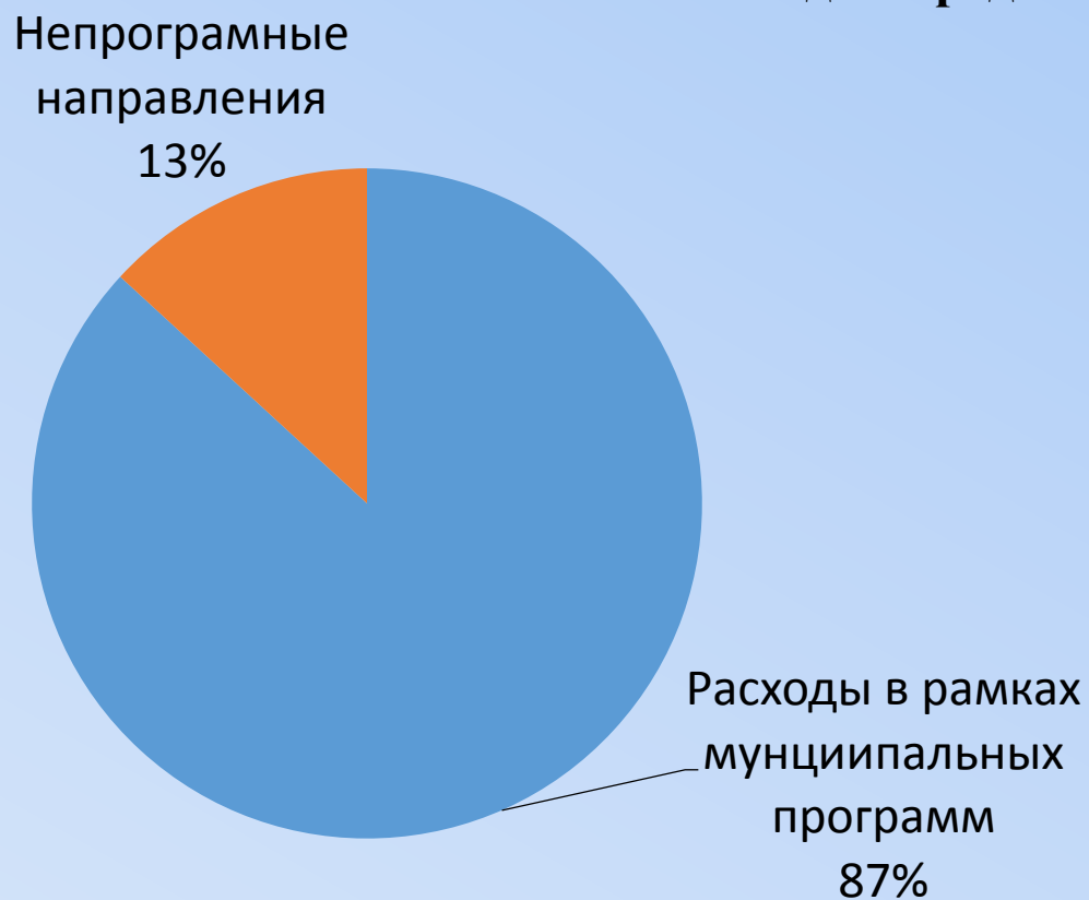
Расходы городского бюджета 2020 год

Наибольшая часть расходов городского бюджета осуществляется в рамках утверждённых муниципальных программ - 459 877,5 тыс. рублей (86,8%), расходы по непрограммным направлениям составляют 69 785,4 тыс. рублей (13,2%)